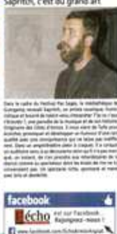
L'Echo d'Armor et d'Argoat 06/05/15

FESTIVAL PRO SAUËZ. Saprit'h, c'est du grand art