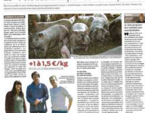
Le Paysan Breton 24/04/15

« Le « Porc Authentique » se vend à prix fixe »