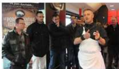
Ouest France Lamballe 25/02/15

« Porc élevé sur paille : Cohérence partage son trophée »