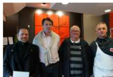
Le Penthièvre 11/03/15

« Les cochons sont meilleurs élevés sur paille : La Cuisine centrale du Penthièvre achète du « Porc Authentique élevé sur paille »